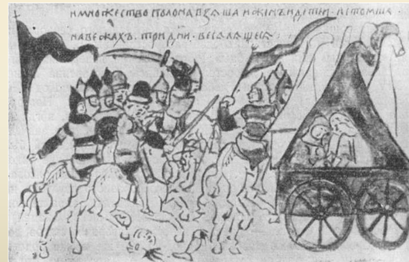
Бій руської дружини з половцями. Малюнок з літопису