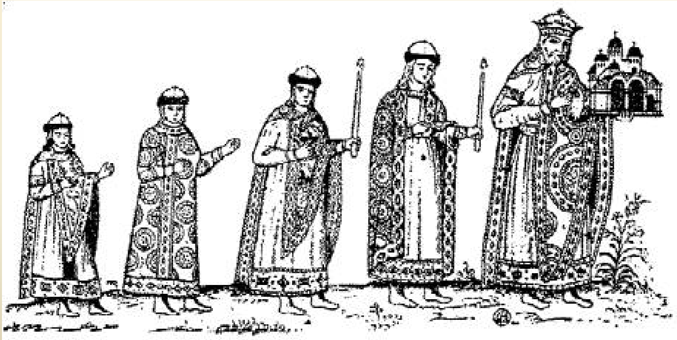
Ярослав Мудрий з дітьми.

Художник розташував дітей за зростом згідно до сімейного старшинства