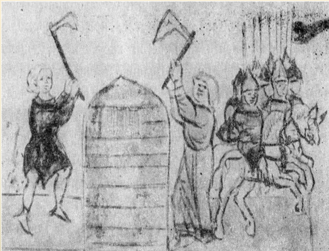
Мініатюра з Радзивілівського літопису

Визволення Всеслава сталося 14 вересня 1068 року , в день Воздвиження. Саме тому у зміщенні зі стола князя-клятвовідступника (Ізяслава) частина населення, і церковної знаті могла вбачати промисел Божий. Ізяслав із братом Всеволодом Ярославичем переяславським утекли з князівського палацу, тут же розграбованого городянами, що взяли «бещисленое множество злата и сребра» .