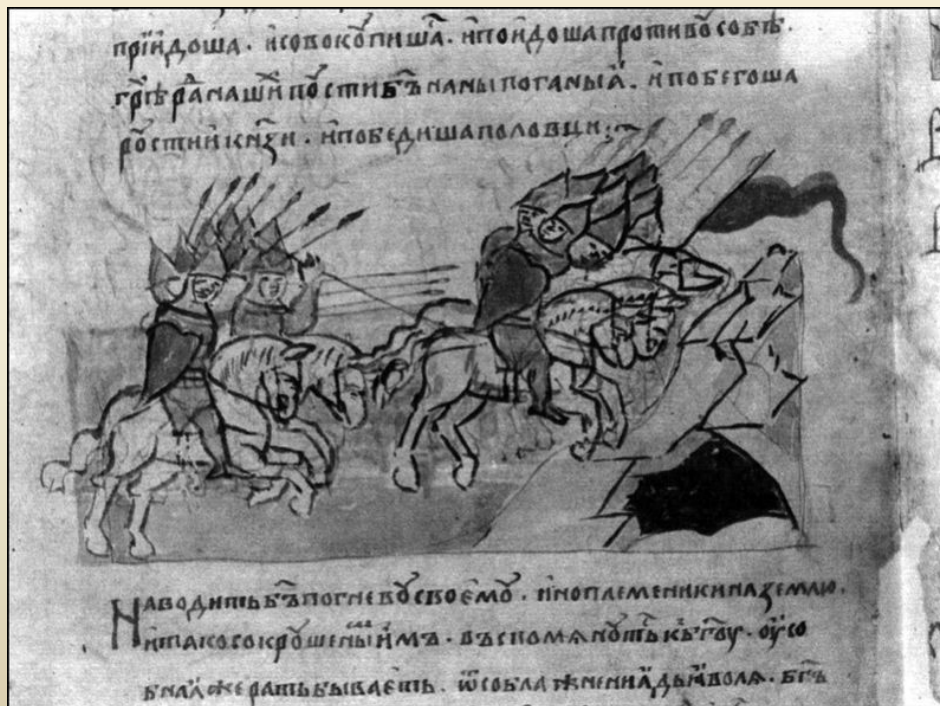
Битва на р. Альта. Мініатюра з Радзивілівського літопису

У РІК 6576 [ 1068]. Прийшли іноплеменники на Руську землю, половці многі. А Ізяслав, і Святослав, і Всеволод вийшли супроти них на [річку] Альту. І коли настала ніч, рушили вони одні проти одних. За гріхи наші напустив бог на нас поганих, і побігли руські князі, і перемогли половці.