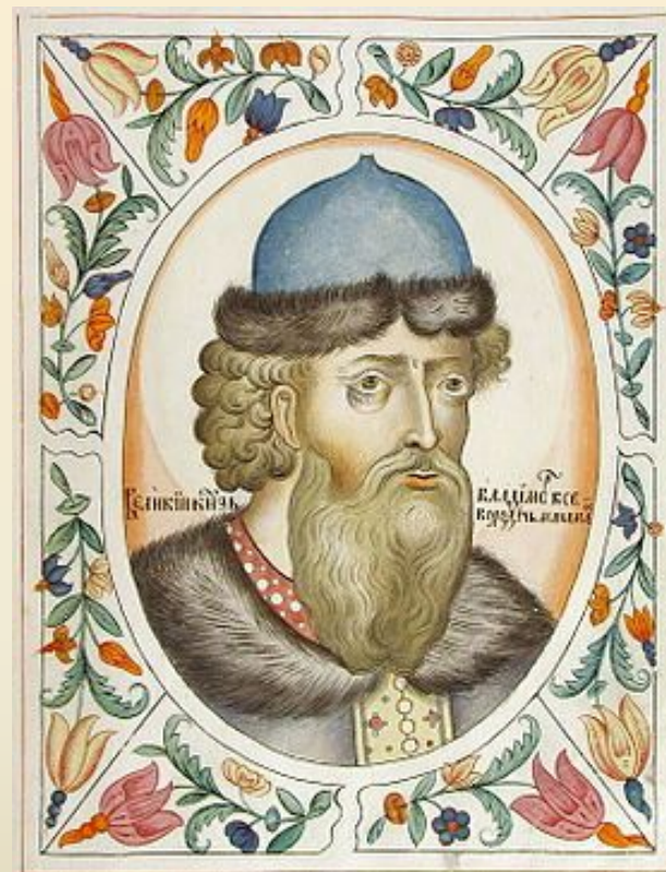
ВОЛОДИМИР МОНОМАХ. ПОРТРЕТ З ЦАРСЬКОГО ТИТУЛЯРНИКА. 1672 Р.