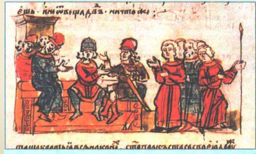
З'їзд руських князів під Києвом. Мініатюра з Радзивілівського літопису

– М. ВИШГОРОД – “ ПРАВДА ЯРОСЛАВИЧІВ” – ЗМІНИ, ВНЕСЕНІ ДО РУСЬКОЇ ПРАВДИ