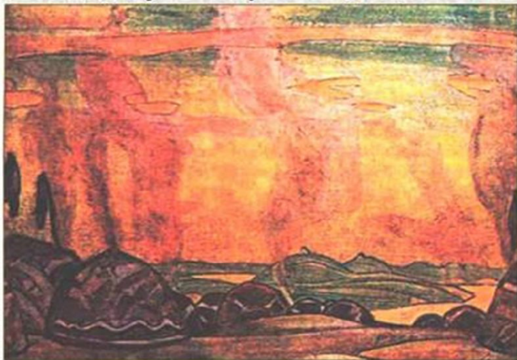
М. Періх. Половецький стан

Половці — тюркський кочовий народ, який в XI-XIII ст. населяв степи між Дунаєм і Волгою, у тому числі Крим і басейн Дону та Сіверського Дінця.