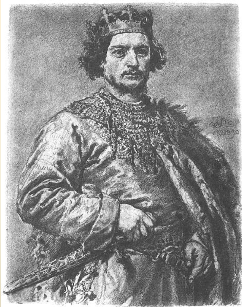
Болеслав II Сміливий. Портретна фантазія Яна Матейко

Навесні 1069 р. Ізяслав разом із братом своєї дружини, польським королем Болеславом II Сміливим , рушив на Київ. Кияни знову організували ополчення і спільно з дружиною і князем Всеславом пішли назустріч ворогам до м.Білгорода.